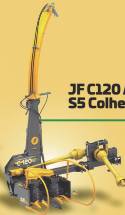
JF C120 AT S5 Colhedora