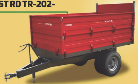
Carreta Triton: CARRETA METÁLICA 5T RD TR-202-