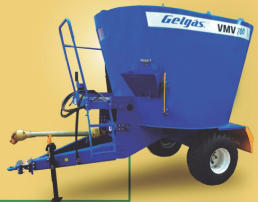
Vagões Gelgas MODELOS VMV 700 VMV 200 VMV 260 VMV 170